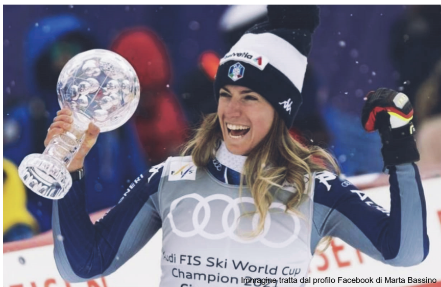
Immagine tratta dal profilo Facebook di Marta Bassino

Campionessa del Mondo nello slalom parallelo a Cortina d'Ampezzo e vincitrice della Coppa del Mondo di slalom gigante!