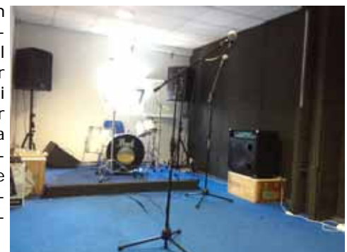
Borgo San Dalmazzo

E' stata inaugurata il 27 aprile scorso la sala prove musicali chiamata "Matrice sonora", nata dal lavoro di un buon gruppo di giovani (borgarini e non), dell'Amministrazione Comunale (Assessorato alle politiche giovanili) e degli educatori della Cooperativa Emmanuele partner del progetto. Si tratta di un risultato importante per i ragazzi che necessitano di uno spazio insonorizzato per provare a suonare. Lo spazio è situato all'interno di Palazzo Bertello, ed è stato possibile recuperarlo grazie ad un progetto sulla "Sicurezza integrata" promosso dalla Regione Piemonte. Chiunque può accedere con la precedenza ai giovani borgarini e residenti nelle Comunità Montane Stura, Gesso e Vermenagna, soggetti patrocinanti dell'iniziativa. Un ringraziamento particolare va agli operai del Comune e al Signor Miraglio. Per saperne di più sugli orari e per l'accesso consultare la pagina "Matrice sonora" di Facebook oppure rivolgersi all'Assessorato alle politiche giovanili.