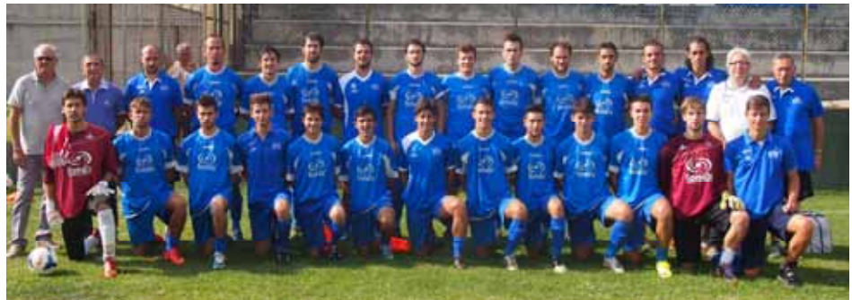
prima squadra - stagione 2014/2015

Il gruppo vincente dello scorso anno ricordiamo la formazione juniores è stato integrato dall'inserimento regionale del Pedona: classificata al di calciatori provenienti dal settore terzo posto nella scorsa stagione ha giovanile della Società ed il tutti i mezzi per puntare ad un Presidente Alessandro Molina è campionato di vertice anche nella fiducioso sulle possibilità di stagione 2015/2016. Un valido ben figurare anche in una gruppo dirigente ed uno staff di competizione di livello superiore. allenatori preparati sta facendo Un appello a tutti i borgarini ad assistere e sostenere la squadra in giovanile già di primissimo livello.