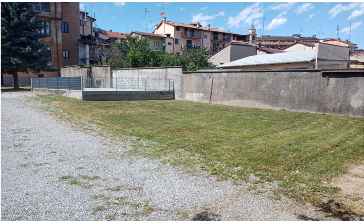
4. Fotografia Area oggetto di intervento