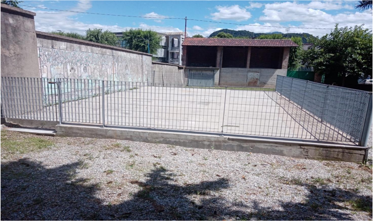
5. Fotografia Area oggetto di intervento