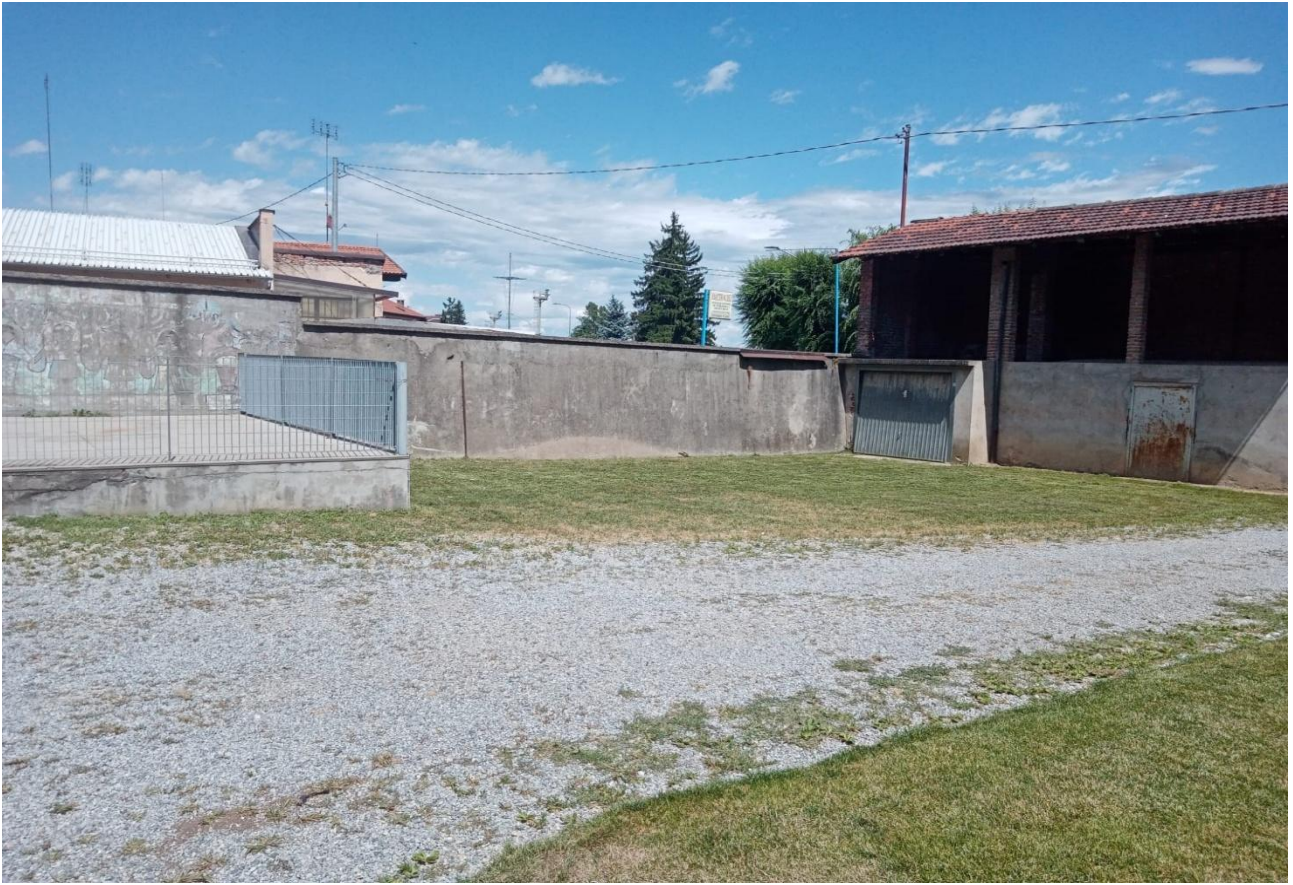
3. Fotografia Area oggetto di intervento