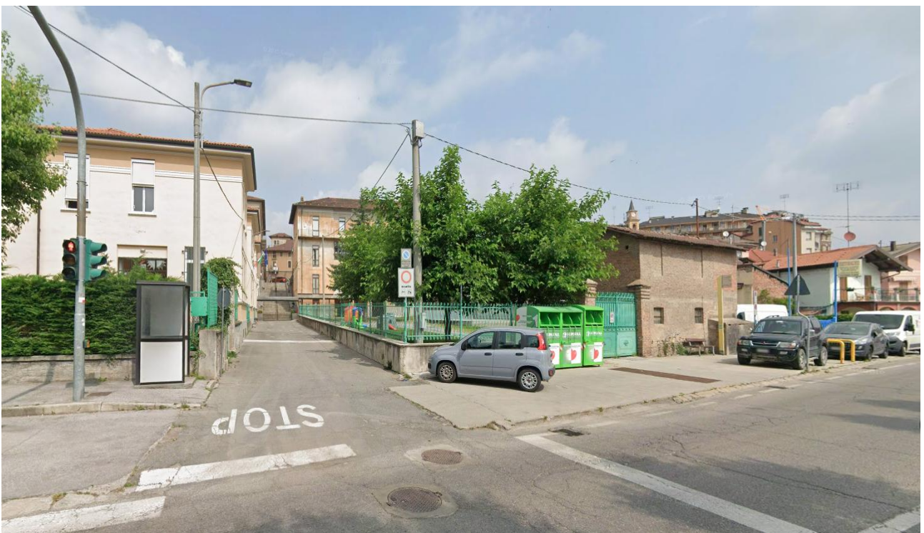
2. Fotografia da Via Vittorio Veneto